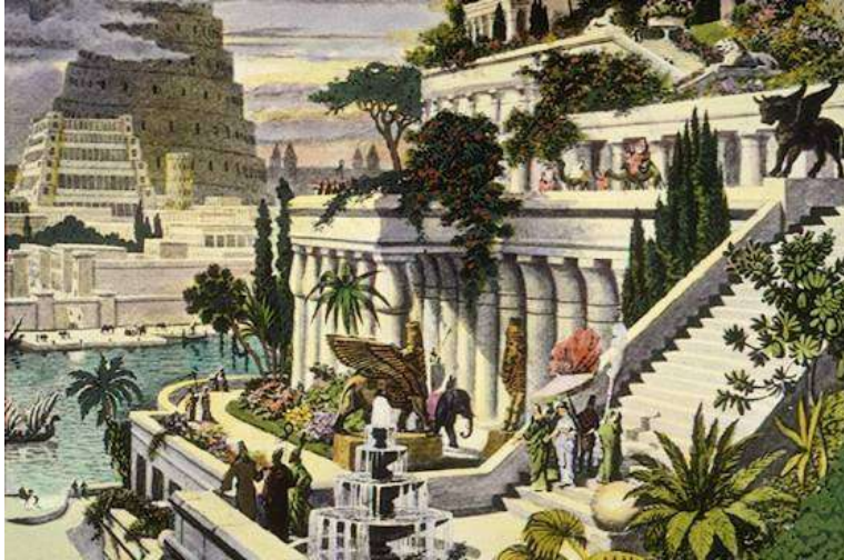
Trung Tâm Thành Babylon của người Iraq cổ xưa

thượng, có bảy đầu và mười sừng. 4 Người đàn bà ấy mặc màu tía mà điều, trang sức những vàng, bửu thạch và hột châu; tay cầm một cái chén vàng đầy những đồ gốm ghiếc và dâm uế. 5 Trên trán nó có ghi một tên, là: Sự Mầu nhiệm, Ba-By-Lôn Lớn, Là Mẹ Kẻ Tà Dâm Và Sự Đáng Gớm Ghê Trong Thế Gian. 6 Tôi thấy người đàn bà đó say huyết các thánh đồ và huyết những kẻ chết vì Đức Chúa Jêsus; tôi thấy mà lấy làm lạ lắm.