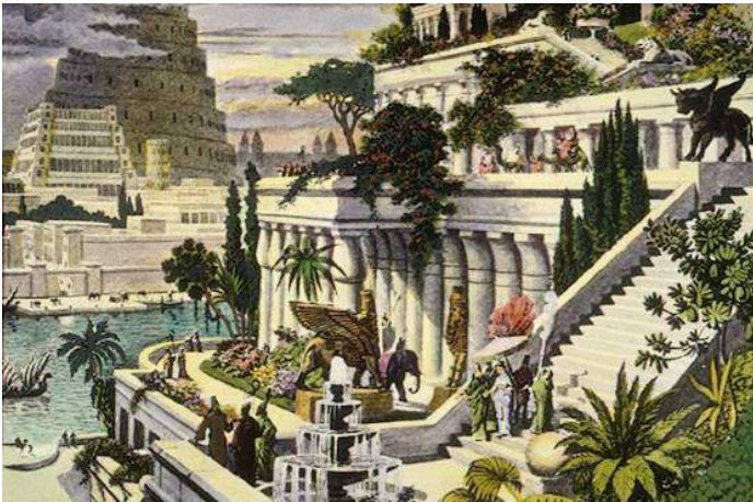
Ancient Babylon Center of Mesopotamian (ancients Iraq)