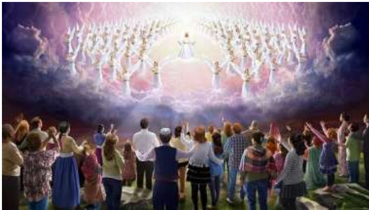
The Judgement Day

Mathew (25:31-41) 31 “When the Son of Man comes in his glory, and all the angels with him, he will sit on his glorious throne. 32 All the nations will be gathered before him, and he will separate the people one from another as a shepherd separates the sheep from the goats. 33 He will put the sheep on his right and the goats on his left. 34 “Then the King will say to those on his right, ‘Come, you who are blessed by my Father; take your inheritance, the kingdom prepared for you since the creation of the world. 35 For I was hungry and you gave me something to eat, I was thirsty and you gave me something to drink, I was a stranger and you invited me in, 36 I needed clothes and you clothed me, I was sick and you looked after me, I was in prison and you came to visit me.’ 37 “Then the righteous will answer him, ‘Lord, when did we see you hungry and feed you, or thirsty and give you something to drink?’ 38 When did we see you a stranger and invite you in, or needing clothes and clothe you?’ 39 When did we see you sick or in prison and go to visit you?’ 40 “The King will reply, ‘Truly I tell you, whatever you did for one of the least of these brothers and sisters of mine, you did for me.’ 41 “Then he will say to those on his left, ‘Depart from me, you who are cursed, into the eternal fire prepared for the devil and his angels.