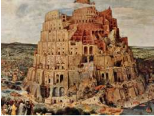
Babylon: Việc gì đã xảy đến cho thành cổ xưa ?