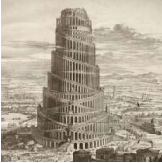
Babylon chống lại Thiên Chúa

3. Dân Chúa phải lánh đi. Khải Huyền (18. 4-8). 4 Tôi lại nghe một tiếng khác từ trời phán rằng: “Hỡi dân ta, hãy ra khỏi nó, nếu các ngươi không muốn dự phần tội lỗi với nó và không muốn lãnh một phần tai vạ của nó.” 5 Vì tội lỗi nó chông chát đến tận trời và Đức Chúa Trời đã nhớ đến các hành động bất công của nó. 6 Nó đối xử với người khác thế nào, hãy đối xử với nó thế ấy, đúng vậy, hãy báo trả gấp đôi những gì nó đã làm; trong ly nó đã pha, hãy pha một phần gấp đôi cho nó.