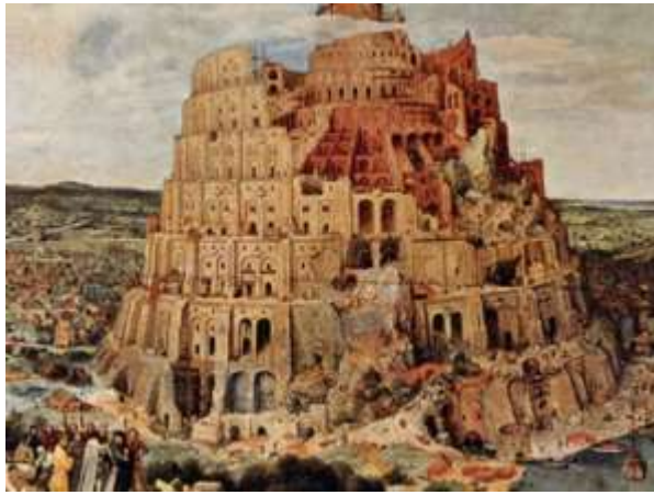
Babylon - What Happend to Ancient City ?

aloud. 16 Alas, alas, for great city that was clothed in fine linen, in purple and scalet, adorned with gold, with jewels, and with pearls !